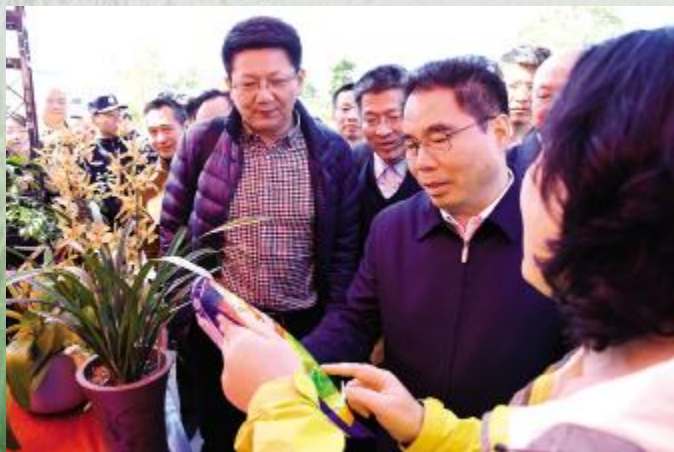
副省长叶贞琴(右二)察看特色农产品

开园仪式现场的都斛“禾海稻浪”水稻田文化主题园只是台山中国农业公园的一部分,整个农业公园范围覆盖台山都斛、斗山、赤溪、广海、端芬五镇,总面积800平方公里,耕地