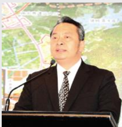
市委书记李惠文在香港举行的推介会上讲话

在推介过程中,市委书记李惠文、市长谢少谋均表示,台山位于粤港澳大湾区“承东启西”的关键节点,处于大广海湾经济区的重点区域和前沿地带。百年前,台山人从这片海域出发,漂洋过海走向全世界;现如今,台山再度从这里扬帆起航,致力成为国际一流湾区的重要一份子。再度腾飞的台山占据天时、地利、人和,迎来了千载难逢的发展机遇。天时,就是党中央、国务院以及广东省委、省政府正加快建设粤港澳大湾区,大广海湾经济区成为大湾区中最具发展潜力的地带。地利,就是交通区位