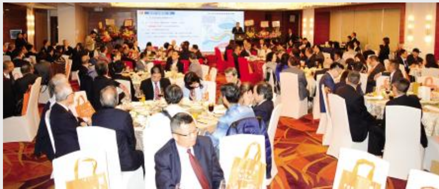
在香港举行的推介会会场