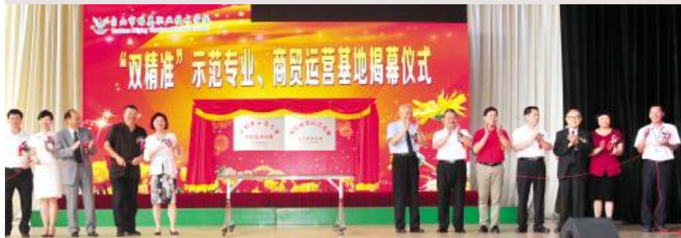
“双精准”示范专业、商贸运营基地揭牌