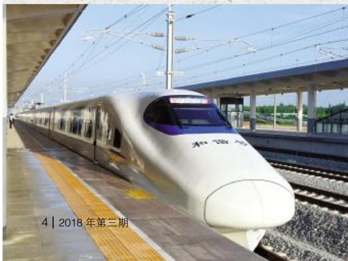
4 | 2018年第三期