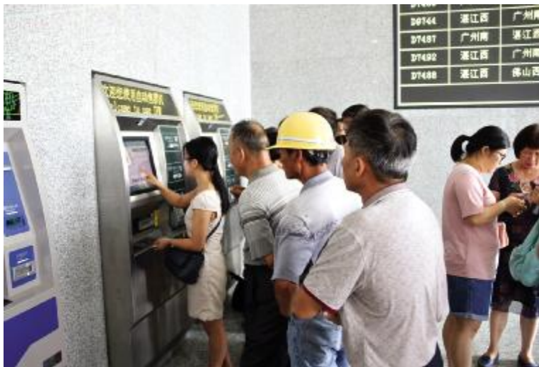
市民排队试用自动售票机