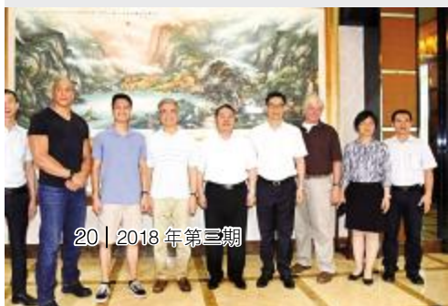
领导与骆家辉一行合影

骆家辉受其父亲影响对家乡怀有深厚感情。从1997年首次回乡起，他已先后六次回到台山探亲祭祖。(恒生)