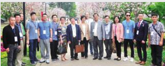
拜访问团一行在石花山公园合影留念