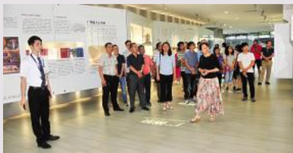
参观广州市地方志新馆