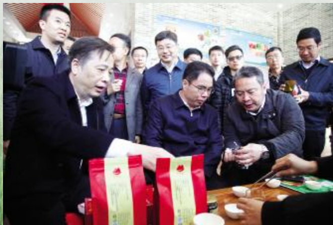
市委书记李惠文(前右一)向副省长叶贞琴介绍台山特色农产品