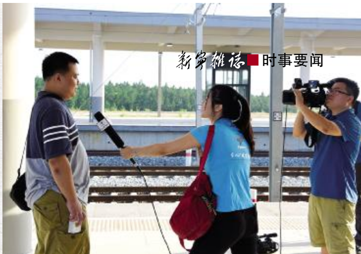
首列旅客(左)谈感受

全长 133 公里，以客运为主。1938 年日本侵略者的铁蹄踏进广东，新宁铁路被毁。