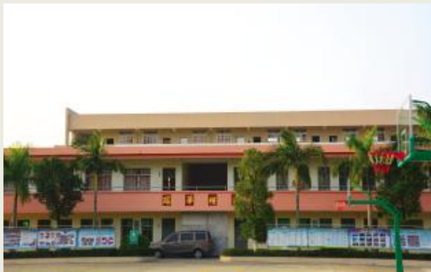
田头中学教学大楼——瑞华楼

“曾杨炳兰教学大楼”建成后，曾瑞棠先生继续关注着田头中学，每次从香港回来，总不忘到学校看看。为了进一步改善学校的办学条件，他从 1989 年起，先后捐资人民币 200 多万元，在田头中学建起了“曾传耀纪念楼”、“瑞华楼”、“瑞辉楼”等。同时他还与热心的香港友人邓华、黄明坚、邝立人等一起捐资人民币 200 多万元在田头中学、田头小学建起了教师宿舍楼、学生宿舍楼、希望楼、同心楼、校门楼等。此外，他还支持赤溪中学、周有福学校、铜鼓小学、长海小学等学校进行改建或扩建，增添教学设备等。从 1995 年起，设立“曾瑞