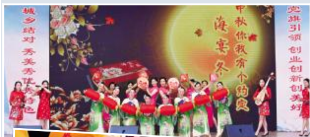
▼开幕式上的舞蹈表演