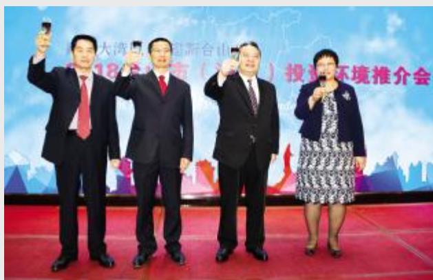
市领导在澳门举行的推介会上祝酒