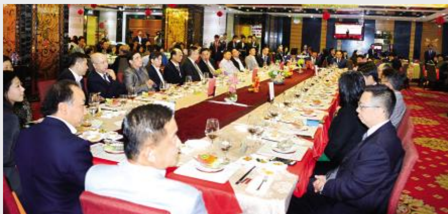
在澳门举行的推介会会场

港、澳门举办投资环境推介会,台山与香港、澳门的合作日益密切,不少香港、澳门朋友选择来台山投资,目前我市内就有港资企业 322 家,投资总额达 162 亿元。