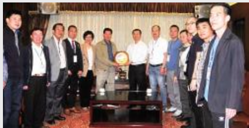
市长谢少谋(左七)向拜访问团一行赠送纪念品