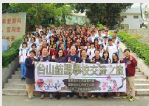
香港黄棣珊纪念中学师生与培正、侨中师生合影留念

通过此次联谊活动，双方相互了解不同地区的文化，传递了互助互学的精神，增进两地学生的友谊，加强姊妹学校之间的情感交流，为两地教育的良好发展打下了基础。 (外事)