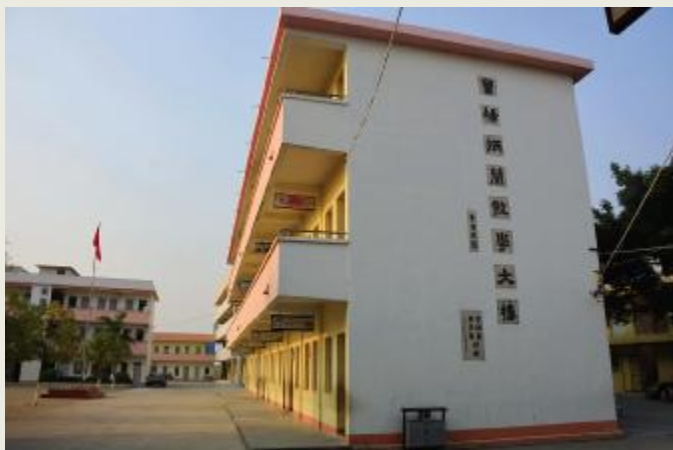
田头中学曾杨炳兰教学大楼