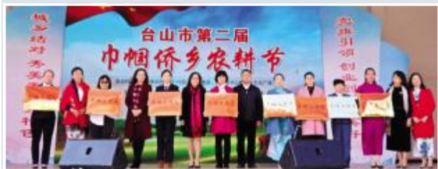
▲为“巾帼文明岗”获得者颁奖

Taishan held the 2 nd Doushan Agricultural Festival to celebrate Women's Day