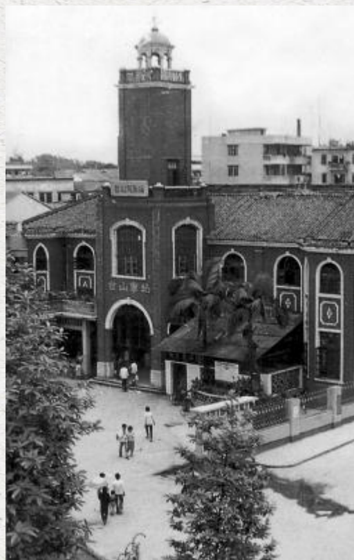
新宁铁路台山总站原址

“和谐号”列车采用的是动车组，挂 8 节车厢，每节车厢满载 70 至 90 人不等。车厢内宽敞明亮整洁，配有可旋转座椅和插头，方便乘客调整座位、为电子设备充电。列车从广州南站出发，到达湛江西站，全程约 2 小时 57 分。从台山站到广州南站，大约需要接近一个小时的时间；从台山出发，到达湛江西站，大约需要两个半小时。