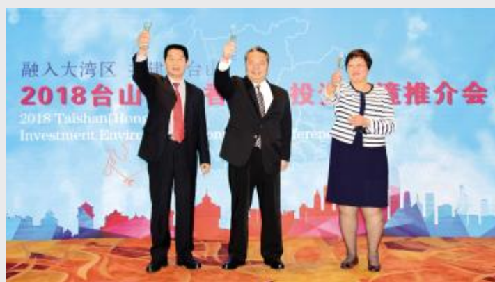
市领导在香港举行的推介会上祝酒

同兴、民生共享。东南部,坚持“既谋又动”,以广海湾工业园区为依托,积极打造战略湾区中心。二是在旅游产业上前景广阔。市委、市政府正着力将我市西南部建设成为旅游集散中心,以“龙头带动、精品串联”为抓手,打造“一核两廊三片区”的全域旅游体系(“一核”是指川山群岛提质升级;“两廊”是指建设汀江华侨文化走廊、海上丝路文化走廊;“三片区”是指建设滨海风光、温泉养生、田园山水等三大片区)。三是在现