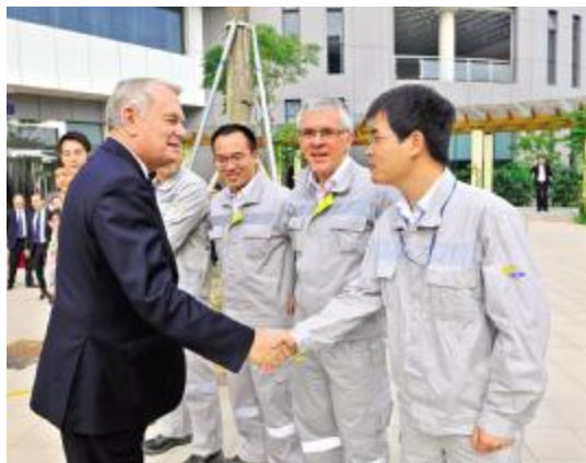
埃罗总理接见核电员工