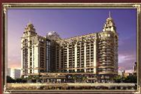
▶ 伯爵半岛&杰灵国际酒店