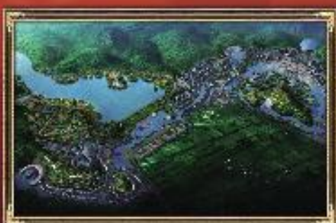
▶ 骑龙山旅游度假区