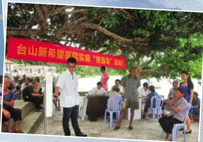
淇洲岛义诊筛查现场