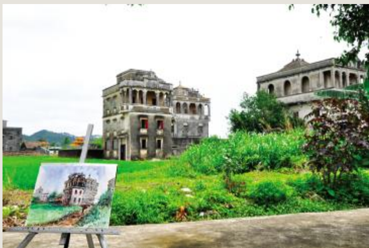
画里画外