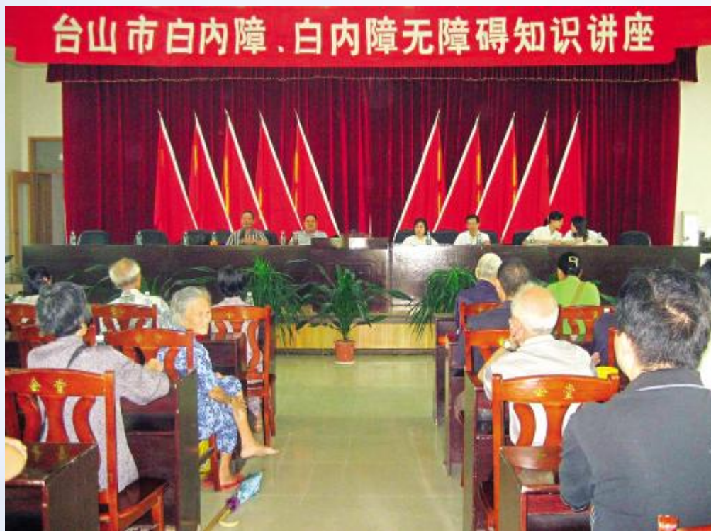
开展白内障无障碍知识讲座

More than eight thousand poor cataract patients have regained their eye sight.