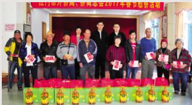
慰问海宴华侨农场归侨