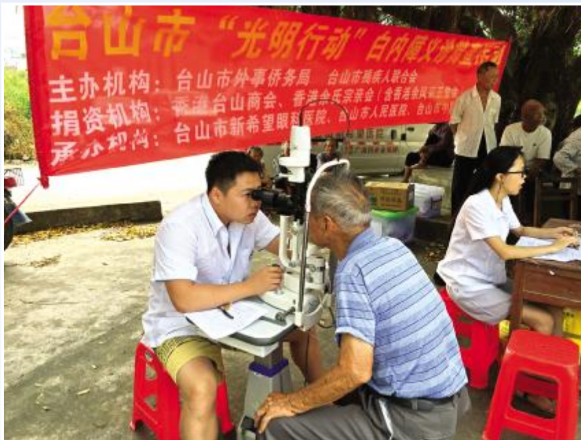
宣传白内障无障碍知识