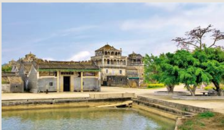
浮月村一角