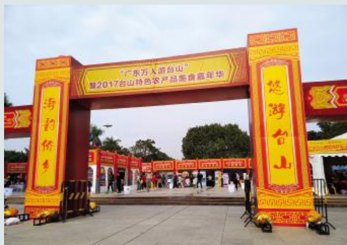
嘉年华会场布展大气隆重