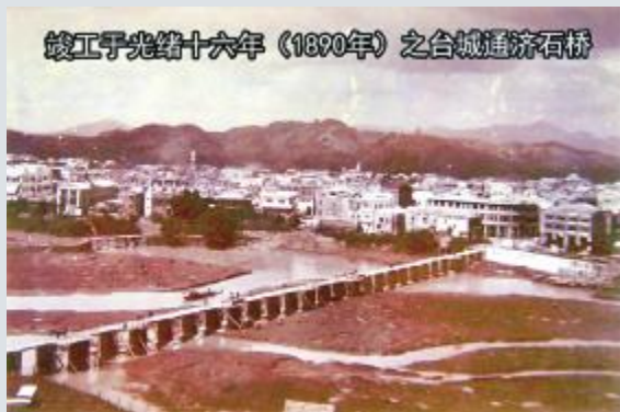
竣工于光绪十六年(1890年)之台城通济石桥