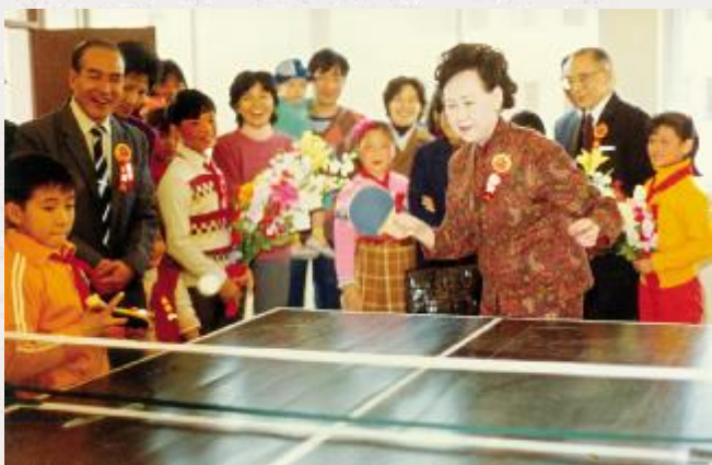
马兰芳女士与小朋友切磋球技