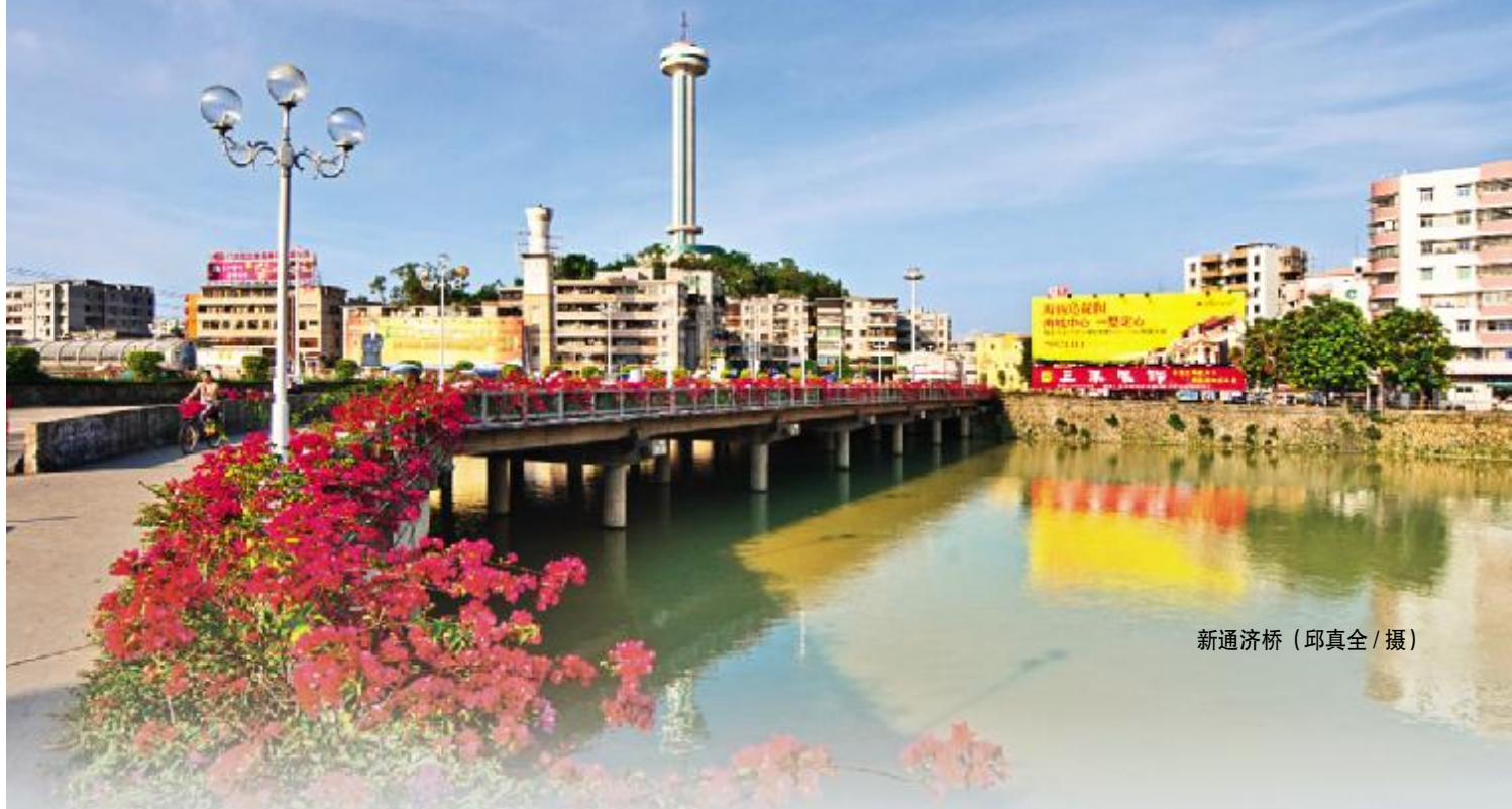
新通济桥