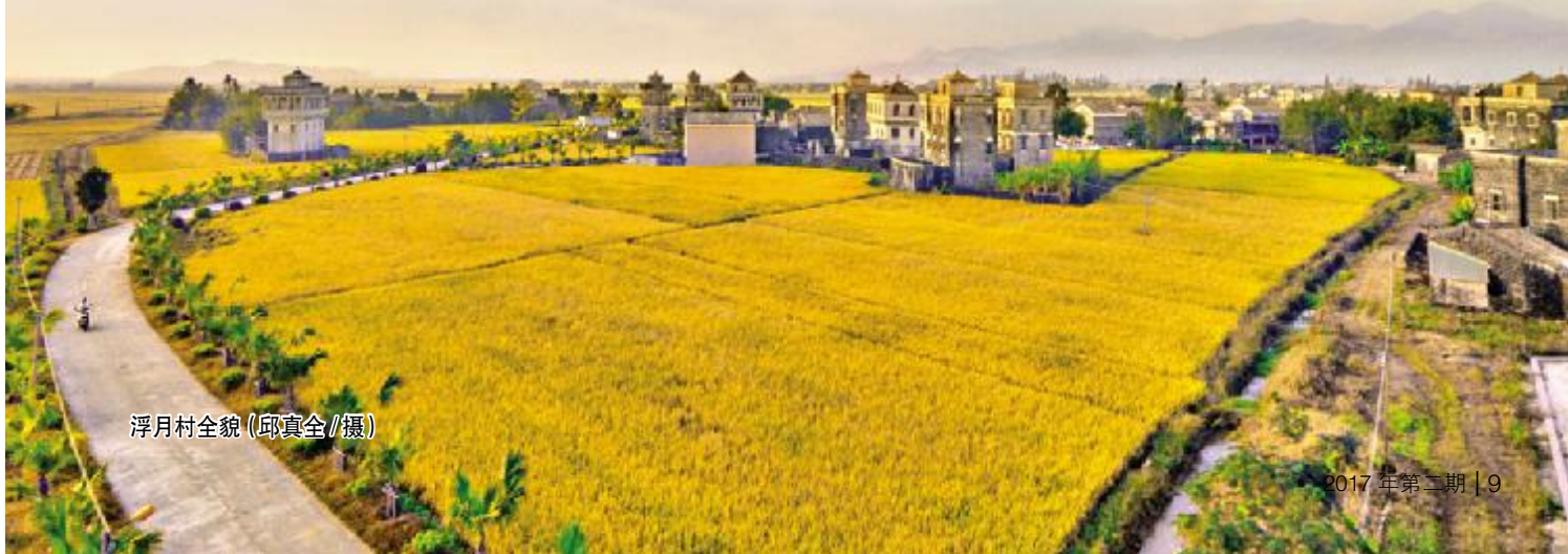
浮月村全貌