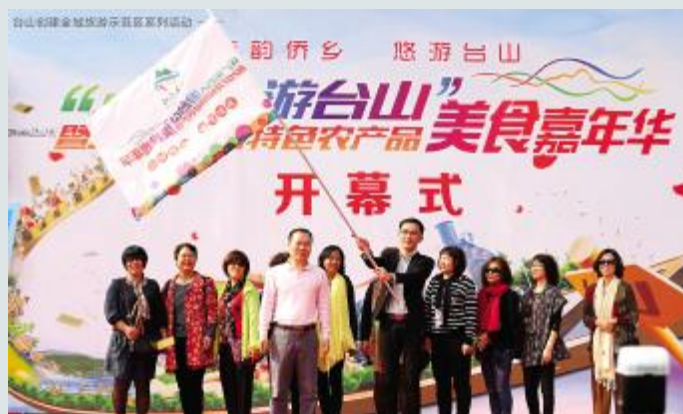
马品高向首发团授旗