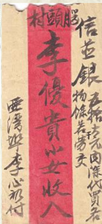
1937年2月20日古巴李陇西寄台山封