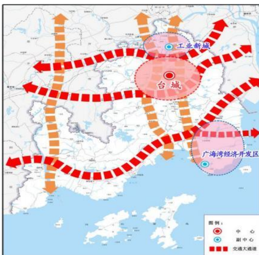
图 3 台山市综合交通空间布局示意图

围绕构建新发展格局战略支点和“一核一带一区”“三区并进”“一主四副多极点”“一核两台三区”区域发展格局和支撑珠海—江门大型产业集聚区开发、助力“六大工程”实施，积极推进综合交通枢纽和综合运输线网建设，加快构建以城区为中心，北部工业新城、南部广海湾经济开发区为副中心，以大江、白沙、北陡、川岛为极点，轴带支撑，多向互联，立体多元的综合交通空间布局。着力打造“三纵三横”综合交通大通道，推动形成以“三铁纵横”轨道网、“四纵三横一联”高速路网、“一纵一横两联”快线网为骨架的综合交通网络格局。