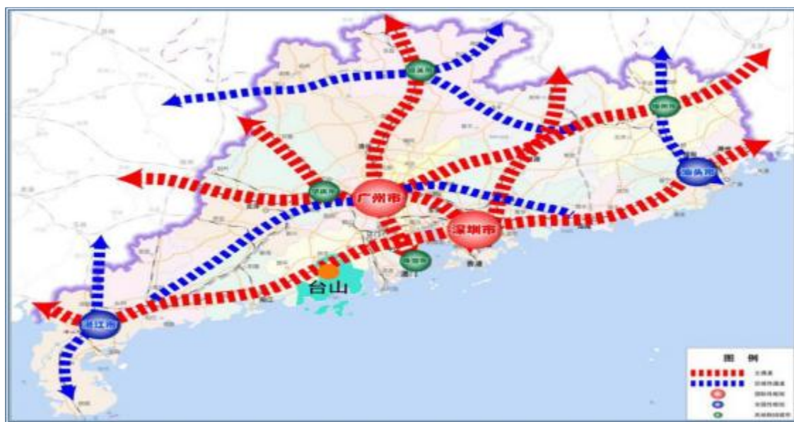
图 1 广东省综合交通规划布局图

台山市位于珠江三角洲西南部，东邻珠海，北靠江门新会区，西连开平、恩平、阳江三市，南临南海，素有“中国第一侨乡”“内外两个台山”之美誉，现辖 16 个镇、1 个街道，截至 2020 年底，常住人口 90.77 万，陆地面积 3286 平方公里。台山市地域广阔，资源丰富，交通区位条件优越，距离广州约 140 公里，距离深圳约 220 公里，距香港 87 海里，距澳门 48 海里，东联粤港澳大湾区核心区域，西扼广东省战略西拓关键节点，是联接粤港澳大湾区与粤西地区的黄金交汇点，台山又是广东省委、省政府提出的珠海－江门大型产业集聚区核心片区，既能有效承接粤港澳大湾区发达地区的溢出效应，更可强力提振珠西地区经济社会发展，未来发展可期。