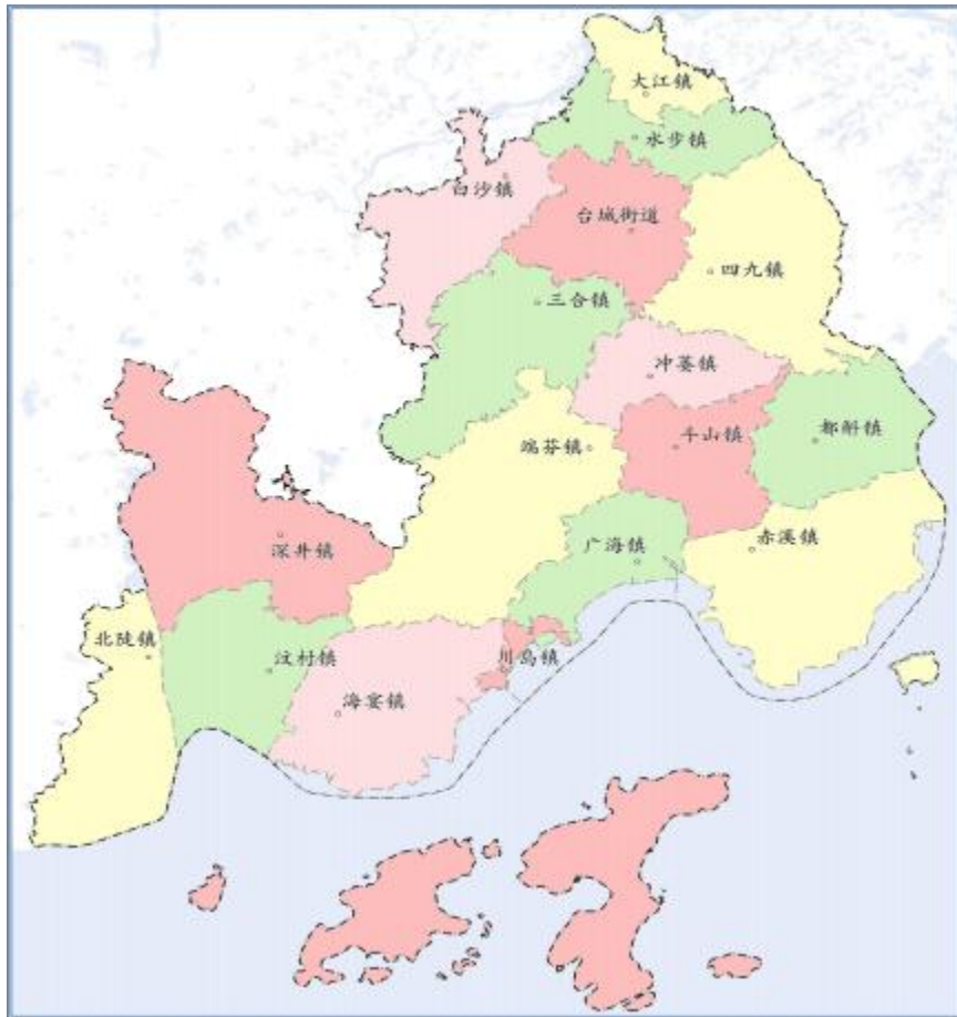
图 2 台山市行政区划简图