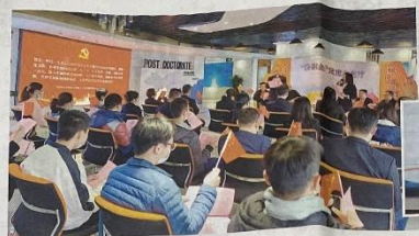
参加活动的嘉宾就培养高素质人才队伍等话题交流。

为深入贯彻落实党的二十大精神，助力江门“人才倍增工程”，12月12日，由江门分行牵头，联合建设银行江门分行共同开展的“检银企”党建会客厅活动走进全国博士后创新(江门)示范中心。参加活动的领导、嘉宾，就加强党建引领、培养高素质人才队伍等话题进行深入交流、建言献策。 文/周 江门日报记者 陈南涛