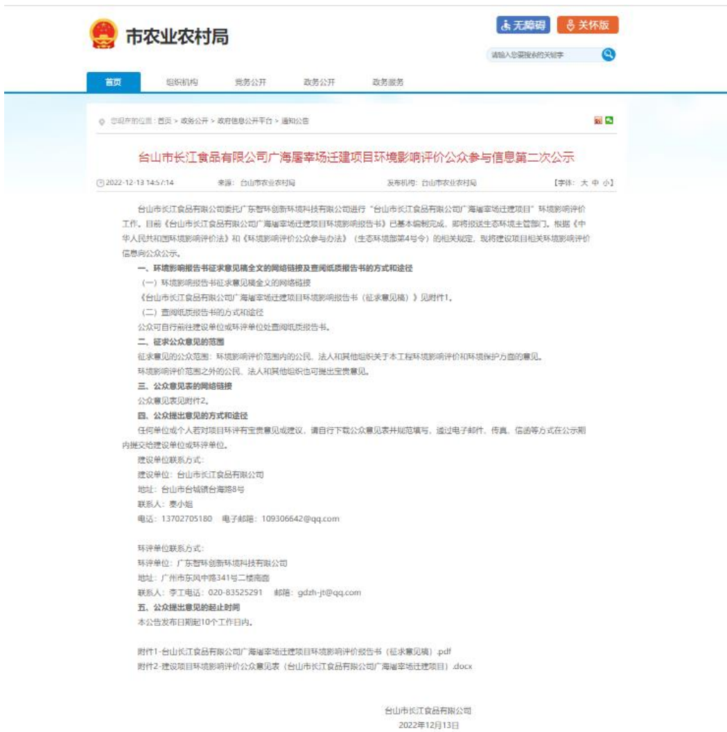
图 3.2-1 本项目第二次公示网站截图