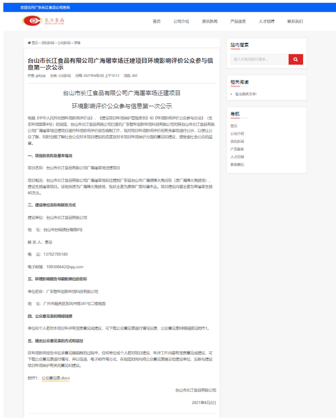
图 2.2-1 本项目首次环境影响评价信息公示截图

境影响评价信息的方式为在所有公众易于接触的“广东智环创新环境科技有限公司”官方网站上公示，因此首次公开环境影响评价信息的载体选取符合《环境影响评价公众参与办法》要求。