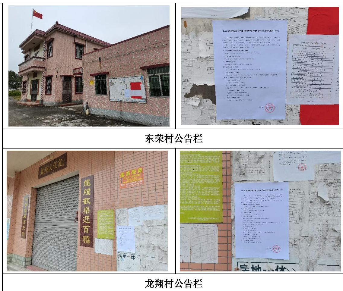
图 3.2-4 本项目征求意见稿公示张贴照片

除了通过网络平台、报纸公开征求意见稿公示信息，同时为了方便当地村民了解项目信息，建设单位于 2022 年 12 月 13 日在东荣村、龙翔村公告栏张贴本项目环评征求意见稿公示信息，公示照片见图 3.2-4。